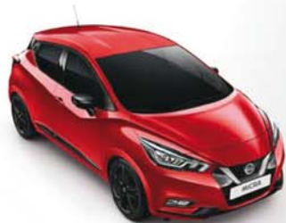
ROUGE VOLCANO - NBD PACK EXTÉRIEUR : NOIR BRILLANT SELLERIE STANDARD