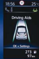
AIDES À LA CONDUITE