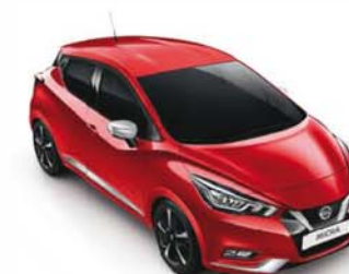
ROUGE VOLCANO - NBD PACK EXTÉRIEUR : CHROME MAT SELLERIE STANDARD