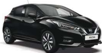
Noir obscur -M- GNE