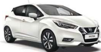
Blanc Perle -S- QNC