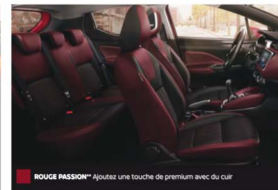
ROUGE PASSION** Ajoutez une touche de premium avec du cuir