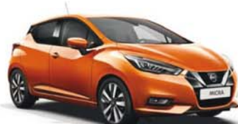
Orange Racing -M- EBF