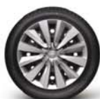
Acier 16" (avec enjoliveurs)