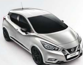
GRIS PLATINE - ZBD PACK EXTÉRIEUR : NOIR BRILLANT SELLERIE STANDARD