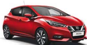
Rouge Volcano -S- NBD