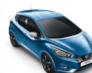
BLEU ELECTRIQUE - RQG PACK EXTÉRIEUR : CHROME MAT SELLERIE STANDARD