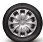
Acier 15" (avec enjoliveurs)