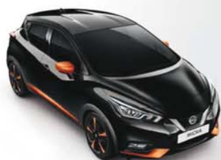
NOIR OBSCUR - GNE PACK EXTÉRIEUR : ORANGE RACING PACK INTÉRIEUR : ORANGE RACING