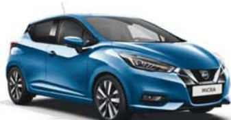
Bleu Electrique -M- RQG