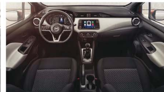
Sellerie Tissu Noir ACENTA