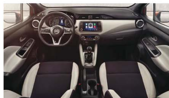
Sellerie tissu sport avec inserts gris et surpiqûres TEKNA