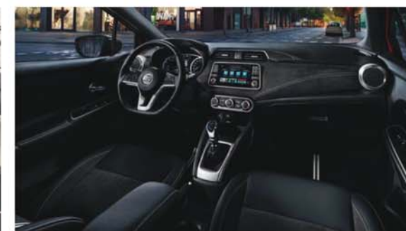
Sellerie mi-Alcantara® mi-TEP (Tissu Enduit) N-SPORT