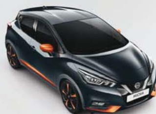
GRIS ACIER - KPN PACK EXTÉRIEUR : ORANGE RACING PACK INTÉRIEUR : ORANGE RACING