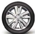
Alliage 16" sans fond noir