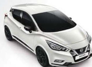
BLANC PERLE - QNC PACK EXTÉRIEUR : NOIR BRILLANT SELLERIE STANDARD