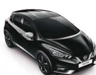
NOIR OBSCUR - GNE PACK EXTÉRIEUR : CHROME MAT SELLERIE STANDARD