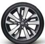
Alliage 17" avec fond noir

*O: Peinture Opaque M: Peinture Métallisée S: Peinture Spéciale **Hauteur totale avec le moteur DIG-T 117.1439MM