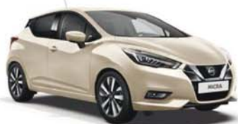
Ivoire -O- D16