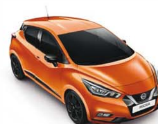
ORANGE RACING - EBF PACK EXTÉRIEUR : NOIR BRILLANT PACK INTÉRIEUR : ORANGE RACING