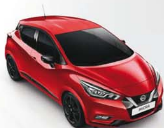
ROUGE VOLCANO - NBD PACK EXTÉRIEUR : NOIR BRILLANT PACK INTÉRIEUR : CUIR ROUGE PASSION (TEKNA UNIQUEMENT)