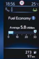
INFORMATIONS DE CONDUITE EN TEMPS RÉEL