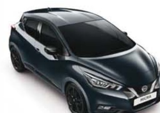
GRIS ACIER - KPN PACK EXTÉRIEUR : NOIR BRILLANT SELLERIE STANDARD