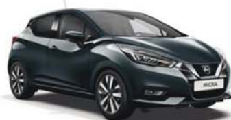
Gris Acier -M- KPN