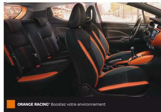
ORANGE RACING* Boostez votre environnement