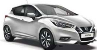
Gris Platine -M- ZBD