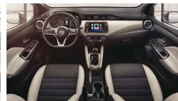
Sellerie Cuir Noir/Gris TEKNA (en option)