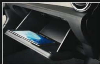
Une boîte à gants d'une capacité de 10L.