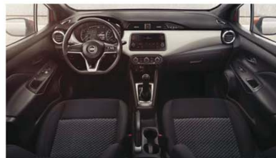
Sellerie Tissu Noir VISIA PACK