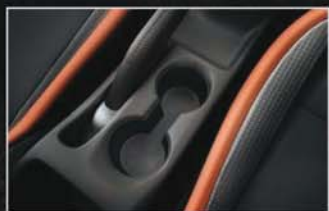
Trois porte-gobelets idéalement placés.

La capacité de chargement de la Nissan MICRA est étonnante. Baissez les sièges arrière pour charger des objets longs ou encombrants et utilisez tous les espaces de rangement pour vos affaires personnelles. Vous trouverez une large boîte à gants, des espaces sur les contre-portes à l'avant pouvant contenir des bouteilles de 1,5L, une poche aumônière au dos du siège passager, un espace pour déposer vos clés ou votre portable avec une prise USB / 12V, et enfin trois porte-gobelets dont deux entre les sièges avant.