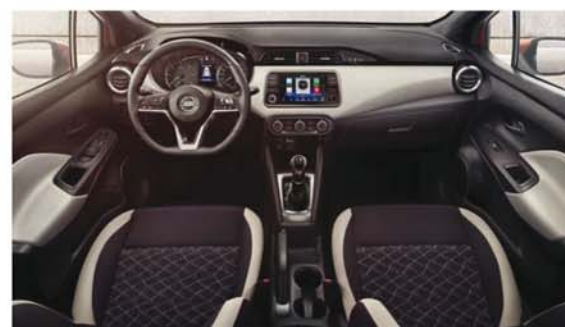
Sellerie bi-ton noir/gris N-CONNECTA