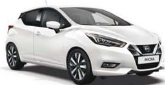
Blanc opaque -O- ZV2