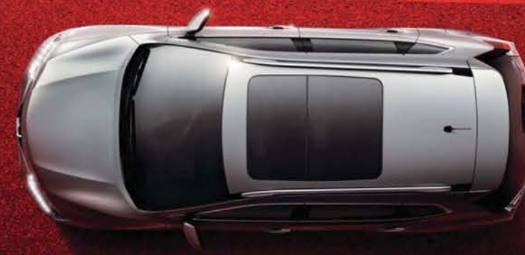
STATIONNEMENT EN BATAILLE