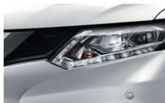
Gris Argent - M - K23