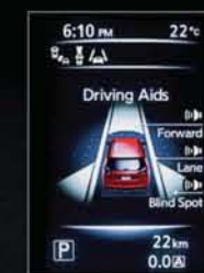
NISSAN SAFETY SHIELD