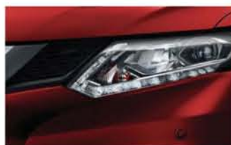
Rouge Rubis - O - AX6