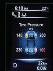
SYSTÈME DE CONTRÔLE DE LA PRESSION DES PNEUS