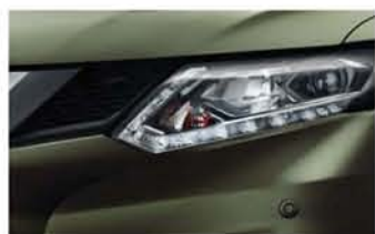
Vert Maquis - M - EAN