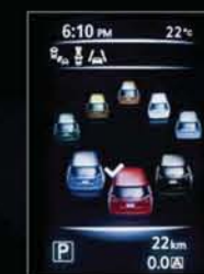
PERSONNALISATION DE VOTRE ÉCRAN