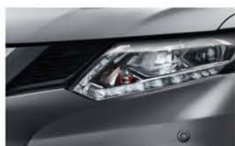
Gris Squalle - M - KAD