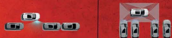
STATIONNEMENT EN CRÉNEAU

Le système d'aide au stationnement intelligent (IPA) identifie les places adaptées à votre X-TRAIL. Une fois l'emplacement validé, il vous assiste et contrôle automatiquement le volant.