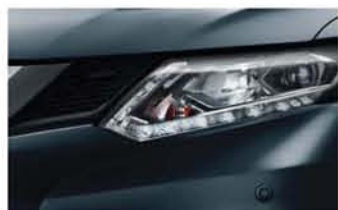
Bleu Abysse - M - RAQ