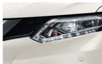
Blanc Lunaire - M - QAB