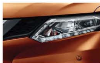
Ambre - M - EAR