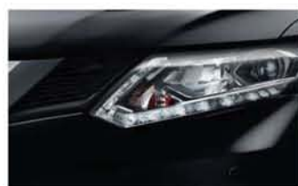
Noir Intense - M - G41